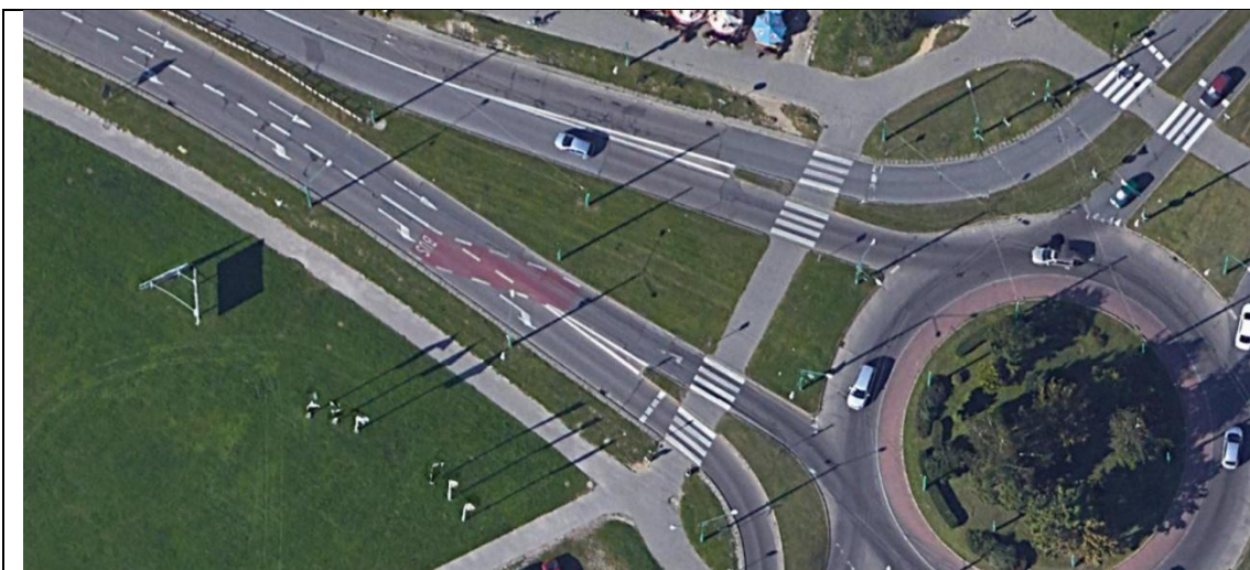
Rysunek 1 Tychy skrzyżowanie ul. Piłsudskiego i Dmowskiego