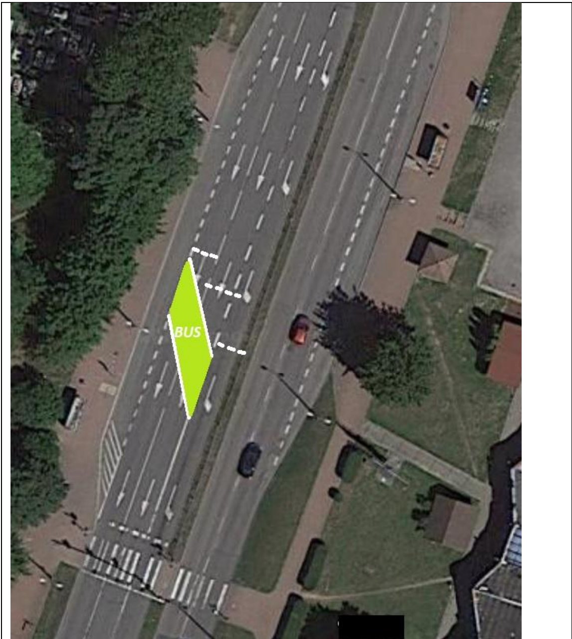
Rysunek 3 Propozycja śluzy na ul. 11-go Listopada dla Autobusów wykonujących skręt w lewo w ul. Hubala Dobrzańskiego